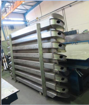
Schlamm / Schlamm 16 m 3 /h