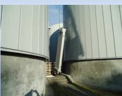
Schlamm / Schlamm 8 - 10 m 3 /h