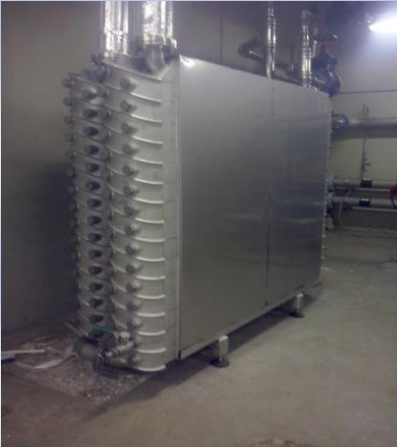
Schlamm / Wasser 16 m 3 /h